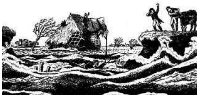
Kerstvloed in het Marnegebied 1717

Vanaf begin van de 20 e eeuw vond een omslag plaats in het denken over de historie. Men begon de waarde in te zien van cultuurhistorisch erfgoed en daardoor kregen archeologische