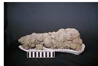
Coproliet van een dinosaurus

zoogdieren, w.o. de wolharige mammoet, leefden in dit gebied. We weten dit omdat tijdens de aanleg van de tweede Maasvlakte door het Havenschap €3 miljoen is uitgetrokken voor archeologisch onderzoek naar de bodem van de Noordzee, waarvandaan veel zand naar de Maasvlakte is vervoerd. Er zijn bv. coprolieten (versteende feces/mest) van hyena's gevonden, waar wetenschappers met behulp van CT-scans allerlei gegevens uit kunnen destilleren.