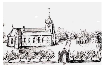
De kloosterkerk van Wittewierum.

Gervasius benoemde Emo tot voorlopig abt van Bloemhof. Het dorp Wierum kreeg daardoor de naam Wittewierum, vernoemd naar de witte monnikspijen van de prémonstratenzer orde.