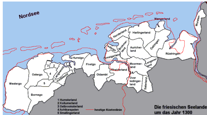
De Friese kustgebieden omstreeks 1300

Zou God na zo'n grote straf Emo nu vergeven hebben?