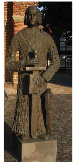
Widukind Hertog der Saksen

Karel vond dat Liudger de Friezen het geloof maar eens moest bijbrengen. Liudger, afstammend uit een oud Fries geslacht, werd in 767 tijdens zijn studie in York tot diaken gewijd. Tien jaar later werd hij in 777, nadat hij nog weer drie jaar in York had gestudeerd, in Keulen tot priester gewijd.